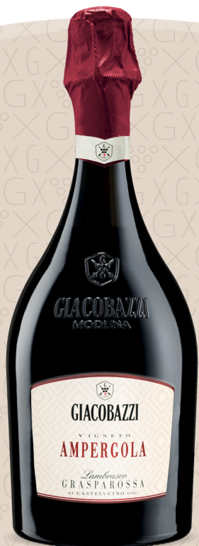
AMPERGOLA Lambrusco Grasperossa di Castelvetro D.O.C.

Nella cantina Giacobazzi, l'attenzione unita ad una solida esperienza per la vinificazione, sono da sempre garanzia di qualità. L'immagine dei vini Giacobazzi comunica un innovativo stile narrativo, che racconta silenziosamente la propria storia fatta di sfide, perseveranza e da un amore tenace per i propri prodotti.