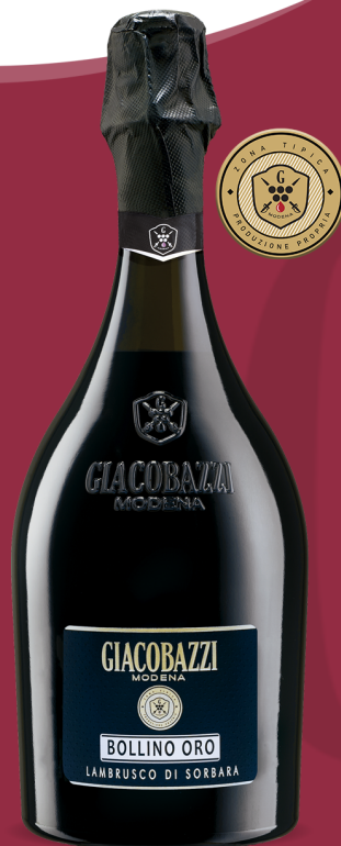
BOLLINO ORO Lambrusco di Sorbara D.O.C.