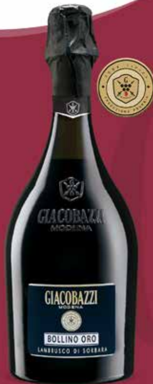
BOLLINO ORO Lambrusco di Sorbara D.O.C.