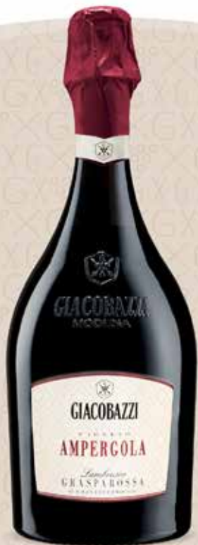
AMPERGOLA Lambrusco Grasparossa di Castelvetro D.O.C.

Nella cantina Giacobazzi, l'attenzione unita ad una solida esperienza per la vinificazione, sono da sempre garanzia di qualità. L'immagine dei vini Giacobazzi comunica un innovativo stile narrativo, che racconta silenziosamente la propria storia fatta di sfide, perseveranza e da un amore tenace per i propri prodotti.