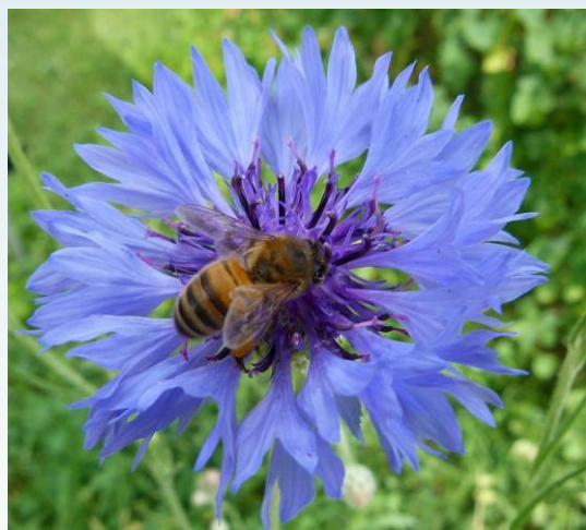
Ape su fiordaliso